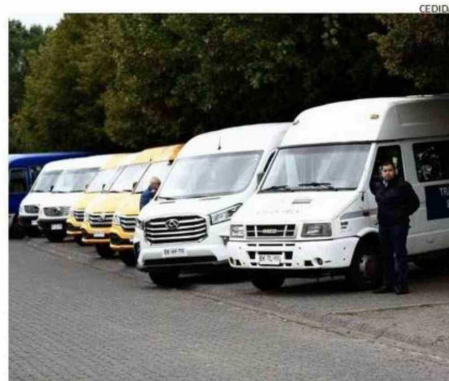
LICITACIÓN ESTARÁ ABIERTA HASTA HOY.