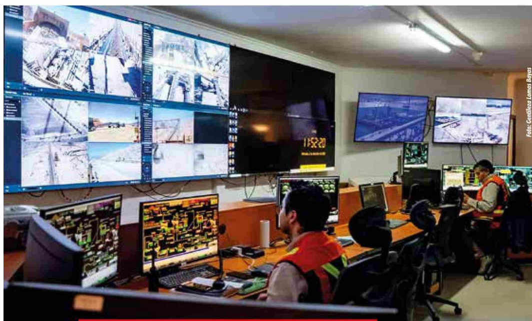
Instalaciones como el SmartCenter han posibilitado una mejora a la gestión de los datos.

Con miras a la optimización de procesos, aplicamos innovaciones en variables hidrodinámicas que mejoran la recuperación de cobre y reducen riesgos "