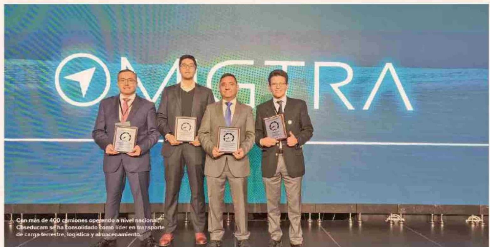
Con más de 400 camiones operando a nivel nacional, Coseducam se ha consolidado como líder en transporte de carga terrestre, logística y almacenamiento.

La empresa ha apostado por una flota moderna y segura, con camiones de las marcas suecas Scania y Volvo, reconocidas a nivel global por su liderazgo en seguridad. A