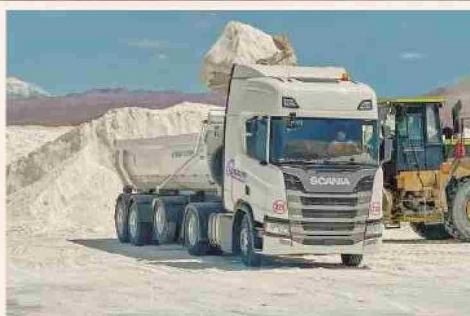
La empresa ha apostado por una flota moderna y segura, con camiones de las marcas suecas Scania y Volvo, reconocidas a nivel global por su liderazgo en seguridad.