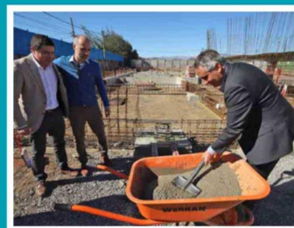
Por estos días se realizó la instalación de la "primera piedra", lo que da inicio oficial a su construcción en Rancagua.