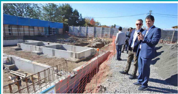
Clínica Centra nace para dar acceso a la radioterapia a pacientes con cáncer y así complementar su tratamiento oncológico de manera óptima y eficiente.

SOMOS UNA DE LAS REGIONES CON MAYORES RETRASOS EN GARANTÍAS GES ASOCIADAS AL CÁNCER; POR LO TANTO, LA APERTURA DE ESTA NUEVA CLÍNICA CENTRA EN 2027 ES UNA ESPERANZA Y UN MEJORAMIENTO EN LA CALIDAD DE VIDA DE LOS PACIENTES.