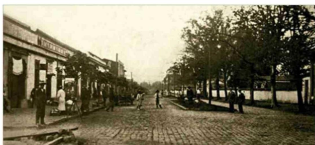
Avda. Estación, hoy Avenida Brasil, vista de sur a norte.