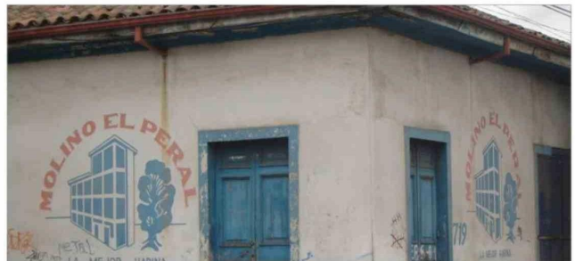
Distribuidora de Molino El Peral, Yumbel esquina Delicias.