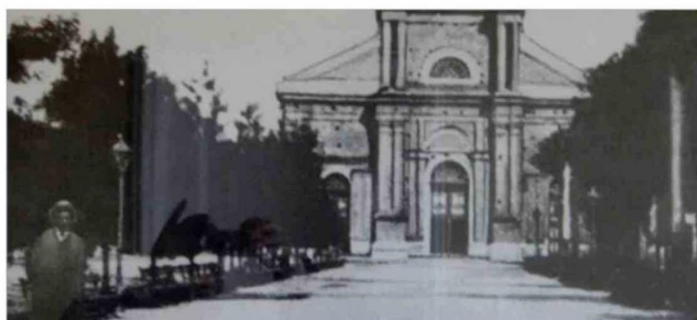
Frontis antigua Catedral de Linares, 1928.