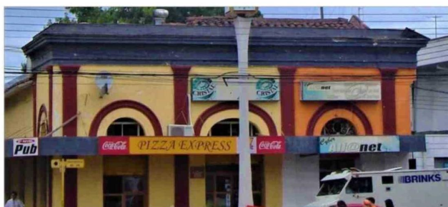
Manuel Rodríguez esquina Independencia, antiguo reloj de la plaza.