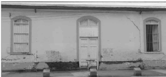
Teatro de Ensayo, Valentín Letelier esquina Benjamín Novoa.