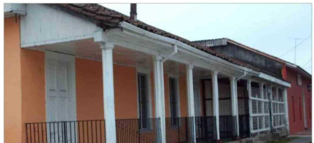
Antigua casa, esquina del museo Lautaro con Delicias.