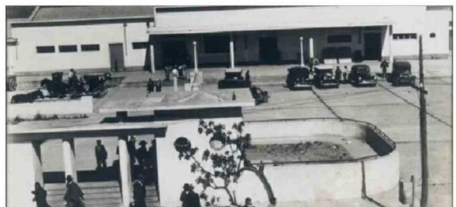
Estación FFCC de Linares, vista del frontis.