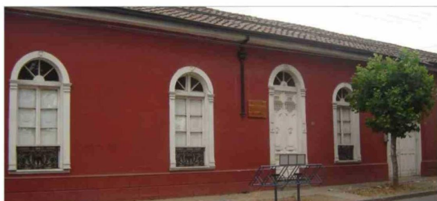
Casa familia Catalán Parada, calle Delicias.