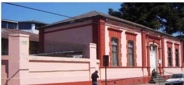
Frontis ex Escuela N 1, hoy Isabel Riquelme.