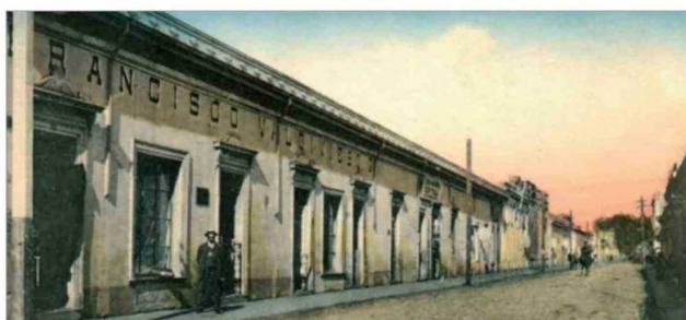
Calle Comercio, hoy Manuel Rodríguez entre Delicias y Maipú.