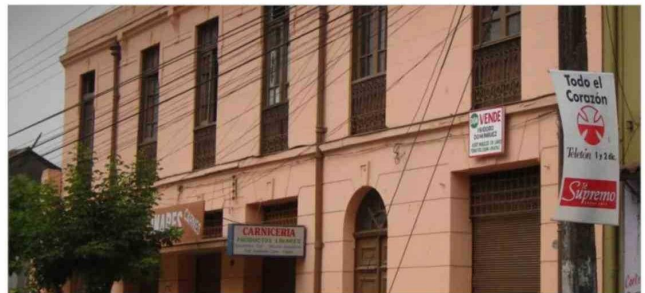
El Negro Bueno, calle Brasil, casi esquina Independencia.