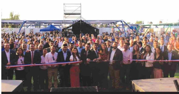
Autoridades regionales y ejecutivos de la Corporación Regional de Desarrollo Productivo de la Región de Coquimbo, representante de empresas expositoras, emprendedores y público general, durante el corte de cinta inaugural.