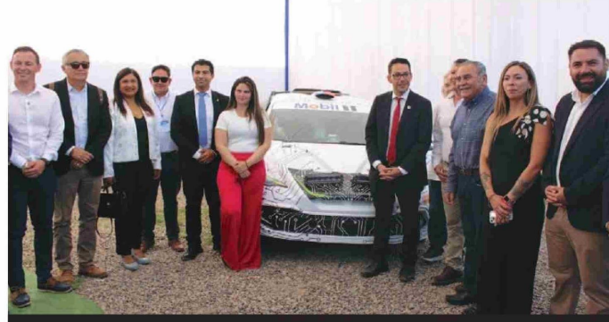
Autoridades regionales visitando el stand de Copec, durante el recorrido por la feria.