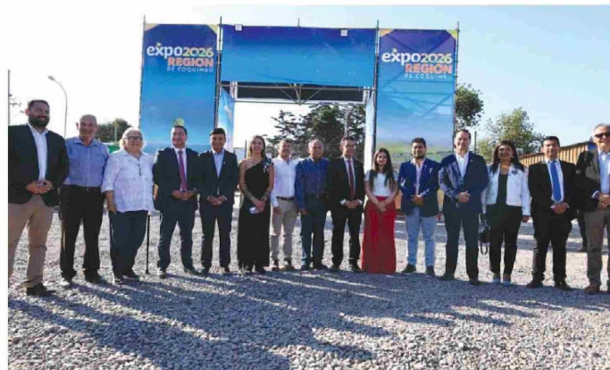
Autoridades regionales durante la inauguración.

Expo Región de Coquimbo, un espacio que celebra lo mejor de nuestra región: el talento local, la innovación, el emprendimiento y el trabajo colaborativo hacia el futuro, un punto de conexión entre personas, ideas, instituciones y empresas que creen en el desarrollo regional con identidad y propósito.