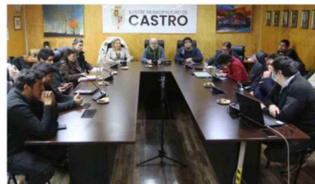
REUNIÓN DE LA COMISIÓN EN LA MUNICIPALIDAD DE CASTRO.