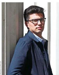
35 años al momento de realizarse la selección en 2021.