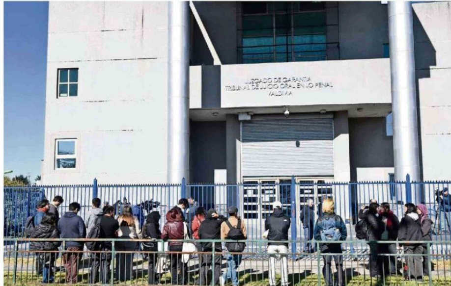
EN EL JUZGADO DE GARANTÍA DE VALDIVIA SE RESOLVIÓ AYER LA FORMALIZACIÓN DE QUIENES HABÍAN SIDO DETENIDOS EN HORAS DE LA MAÑANA.

"Agradecemos el gran trabajo de PDI y Fiscalía, en el proceso de investigación. Ya tenemos antecedentes y hechos concretos que son estudiantes de la universidad quienes han sido detenidos. Somos un Gobierno de diálogo, pero ante estos hechos de violencia somos categóricos: no los vamos a aceptar. Toda la información está siendo entregada y está