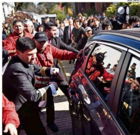
LAS AGRESIONES SE PRODUJERON EL 8 DE ABRIL, EN LA UACH.

Ambos declinaron referirse a eventuales responsabilidades del Gobierno a nivel regional por no haber previsto medidas de seguridad para la Ministra Lincolao.