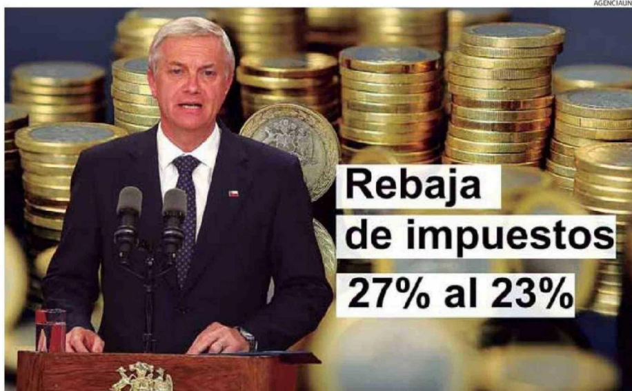
EL PRESIDENTE JOSÉ ANTONIO KAST PRESENTÓ LAS MEDIDAS DEL PROYECTO DE LEY PARA LA RECONSTRUCCIÓN NACIONAL Y DESARROLLO ECONÓMICO.

Se trata de iniciativas que buscan reducir el gasto público, pero también incentivar la inversión que permitan mejorar las cifras de crecimiento, y de ese modo, generar nuevos empleos.