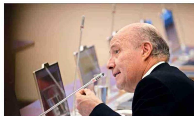
El ministro de Hacienda, Jorge Quiroz, ha advertido sobre una mayor presión fiscal para este año.

drá una mayor presión a las finanzas públicas", influyendo en una mayor emisión de deuda.