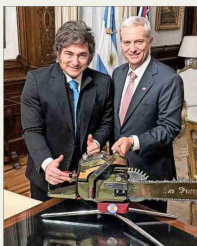
Kast visitó a Milei en diciembre pasado, a pocos días de haber ganado la elección.

En La Moneda, en tanto, la ministra de la Secretaría General de Gobierno (Sege-