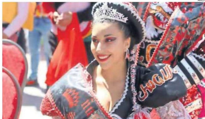
LA TIERRA DE SOL Y COBRE DESTACA POR SU TRADICIONES Y APEGO A LA TIERRA.

“Viene un elemento de expansión de manera lenta en la década de 1920, a veces muy ligado a lo que sucede en el centro mineral de Chuquibambilla. Va también a verse azotado en la década de 1950 por