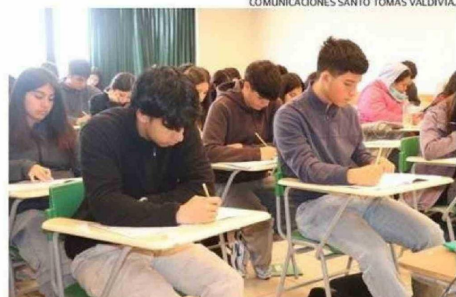
COMUNICACIONES SANTO TOMÁS VALDIVIA.