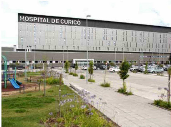
Hospital de Curicó es el centro asistencial del Maule que sufrirá el mayor recorte con 1.600 millones de pesos.