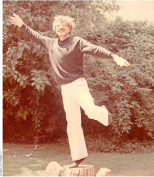
HUMBERTO MATURANA ÍNTIMO: LA HISTORIA QUE CUENTA SU ARCHIVO FAMILIAR PÁGINA 4