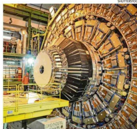
EL ACCELERADOR DE PARTÍCULAS MÁS POTENTE DEL MUNDO.