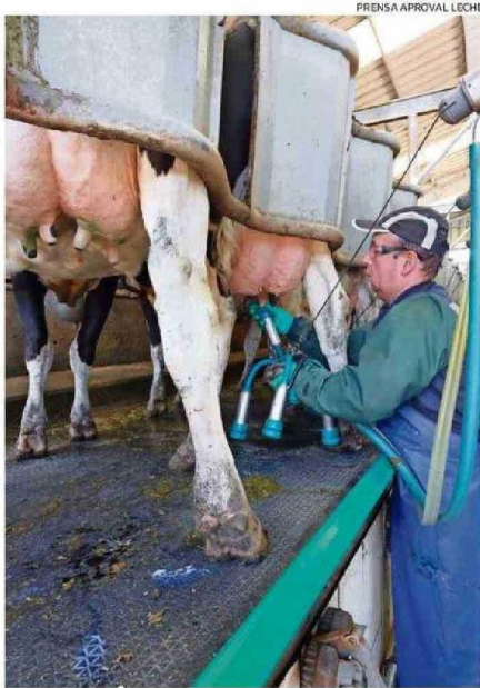
PRENSA APROVAL LECHE

De acuerdo a los antecedentes proporcionados, la cooperativa Colun procesó casi el 90% de la leche recepciónada en Los Ríos, consolidando su