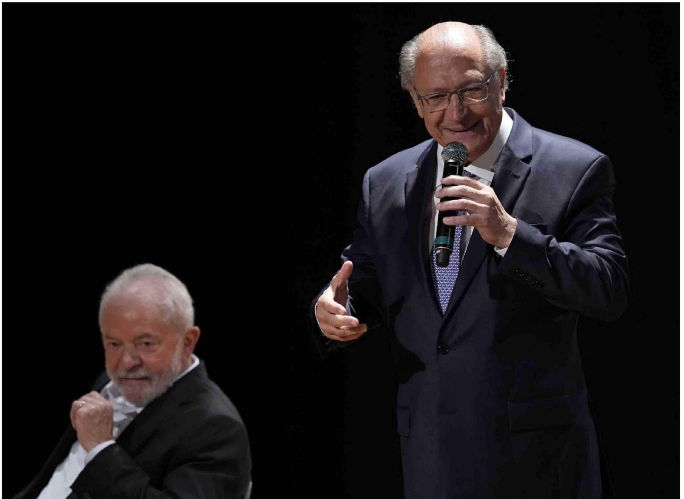
► El presidente Luiz Inácio Lula da Silva y su compañero de fórmula Geraldo Alckmin en Brasilia, el 10 de noviembre de 2022.