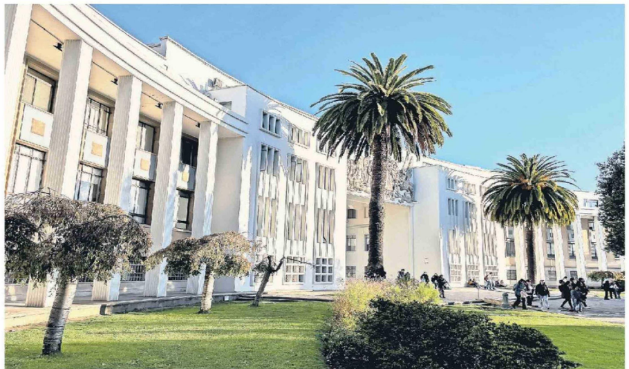
El Arco de la Universidad de Concepción podrá ser recorrido este sábado 30 y domingo 31 de mayo desde las 10 horas. Para inscribirse en los tours guiados hay que revisar patrimonio.udec.cl/dia-patrimonio .