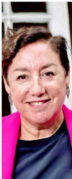
Beatriz Sánchez, senadora del Maule por el Frente Amplio.