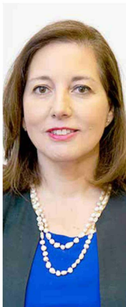
Paulina Vodanovic, senadora del Maule por el Partido Socialista.