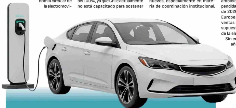
VENTAS DE BAJAS EMISIONES ALCANZAN 16,8% DEL MERCADO AUTOMOTOR