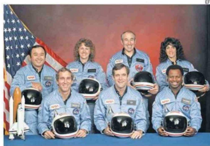
LA TRIPULACIÓN FALLECIDA.

A bordo del transbordador Challenger viajaban los astronautas Francis 'Dick' Scobee, Michael J. Smith, Judith Resnik, Ronald McNair, Ellison S. Onizuka, Gregory Jarvis, y la profesora Christa McAuliffe.