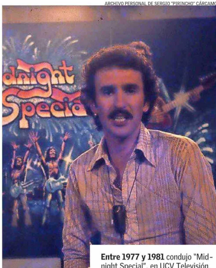
Entre 1977 y 1981 condujo "Midnight Special", en UCV Televisión.

el resto de mis compañeros. Sí, el rock se va reciclando a sí mismo y siempre aparece alguna novedad".