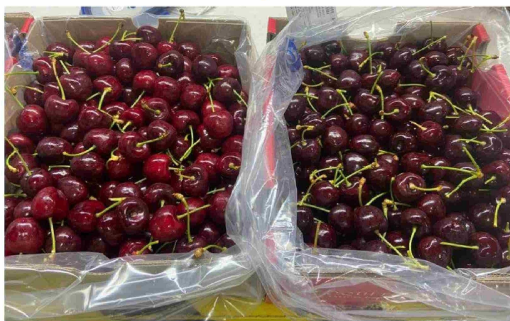
La fruta de color oscuro tiene un potencial de almacenamiento de pocos días. El color óptimo de cosecha se encuentra en las tonalidades caoba.

CO 2 aumenta; con lo que se logra reducir aún más la respiración de la fruta.