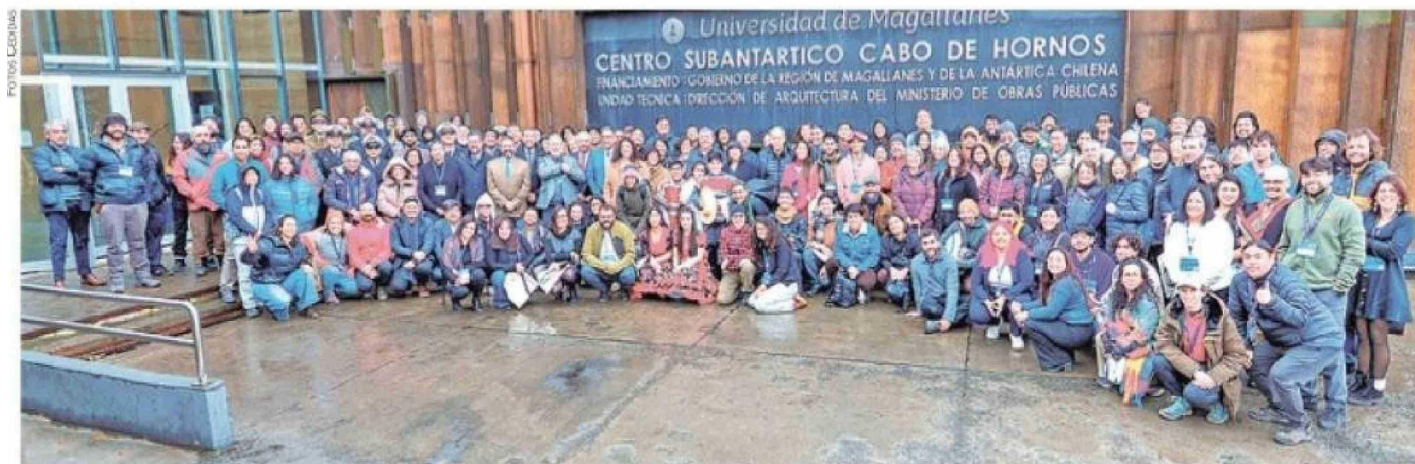
Los asistentes a la primera jornada del evento internacional realizada este lunes en la ciudad más austral de Chile, Puerto Williams.