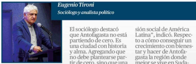
Eugenio Tironi Sociólogo y analista político

“Antofagasta, hoy le tiene que hablar al planeta”