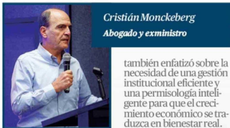
Cristián Monckeberg Abogado y exministro

también enfatizó sobre la necesidad de una gestión institucional eficiente y una permisología inteligente para que el crecimiento económico se traduzca en bienestar real. “La región tiene un sinnúmero de alternativas, de proyecciones, de crecimiento. Los problemas urbanos no se resuelven solo con infraestructura, sino con mejores instituciones, incentivos, capacidad pública. Tenemos que ir buscando otra solución para que efectivamente el bienestar llegue, pero que llegue con rapidez y no es solamente crecimiento material, sino es calidad de vida. A eso me refiero con crecimiento y bienestar”.