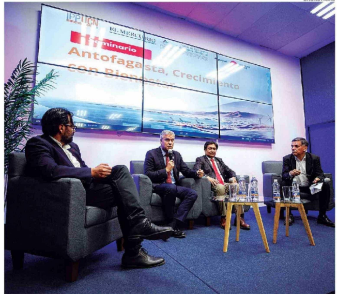
EL SEMINARIO SE REALIZÓ AYER EN EL AUDITORIO DE EL MERCURIO DE ANTOFAGASTA.

El trabajo en conjunto, dejando de lado la rivalidad política, fue uno de los puntos más destacados, al igual que, la importancia de la cohesión social. CS