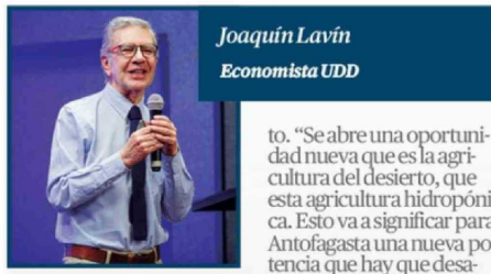
Joaquín Lavín Economista UDD

El exministro apuntó a la paradoja del desarrollo en la Región de Antofagasta y como actualmente a pesar de las inmensas riquezas mineras y energéticas, los habitantes perciben una calidad de vida deficiente debido a problemas como la falta de infraestructura y campamentos. Monckeberg