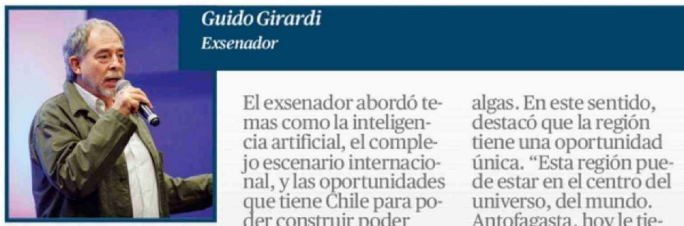
Guido Girardi Exsenador

“El desarrollo de esta región depende de todos”