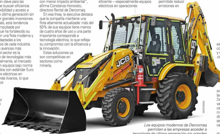
Los equipos modernos de Dercomaq permiten a las empresas acceder a tecnología de última generación sin grandes inversiones iniciales.

logísticas, con tendencia al arriendo de equipos de batería litio— ha permitido reducir emisiones en