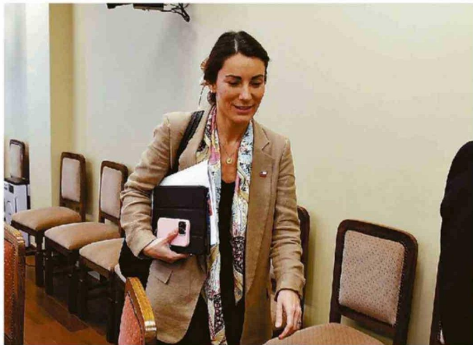
LA MINISTRA DE EDUCACIÓN LOGRÓ QUE EL PROYECTO DE ESCUELAS PROTEGIDAS PASARA RÁPIDAMENTE A SALA.

"Creo que, en general, el sistema político funciona un poco por la contingencia, o sea, el tema está en la contingencia y de alguna manera hay que salir del paso, que yo creo que es un poco lo que se está haciendo ahora. Pero no necesariamente ese salir del paso apunta a las soluciones de fondo, que es lo que nosotros hemos, de alguna manera, criticado en lo que se está haciendo ahora frente a esta situación, donde se toman medi-