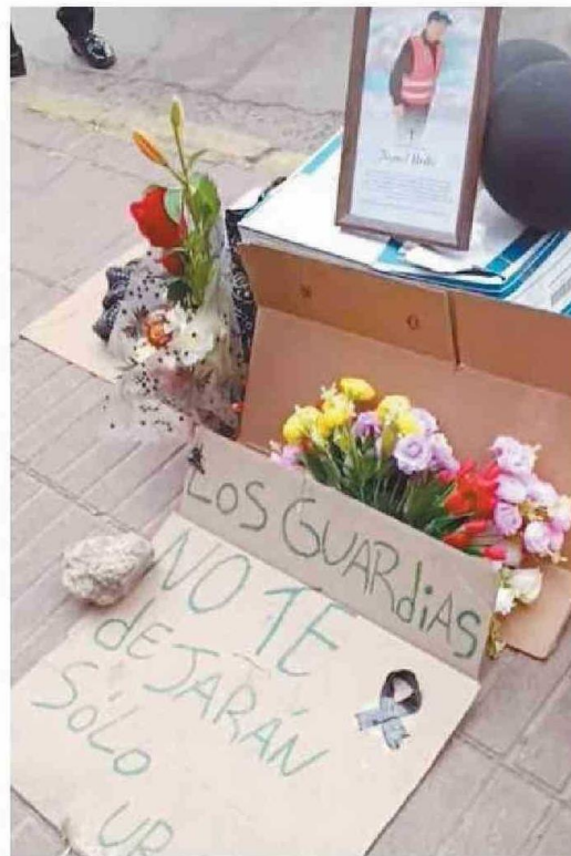
SUS COMPAÑEROS DE TRABAJO Y FAMILIARES SE HAN MANIFESTADO EN EL LUGAR DEL ATROPELLO.

Desde aquella fatídica jornada sus compañeros de trabajo junto a familiares han realizado diversas