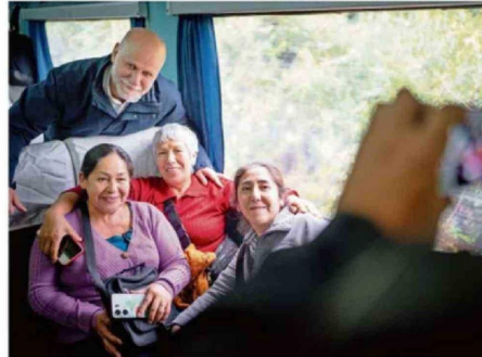
COMUNICACIONES MINISTERIO DEL INTERIOR.

¿Cómo ha sido hasta ahora su experiencia en el Ministerio de Interior, qué momentos han sido los más duros y cuáles los más agradables de este cargo?