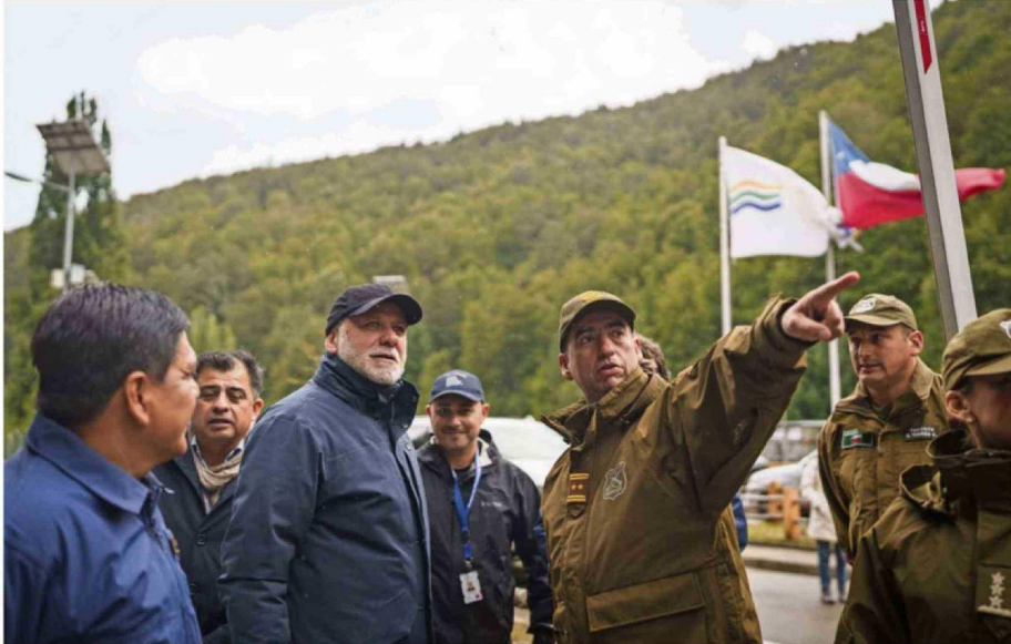
EL MINISTRO DEL INTERIOR SE REUNIÓ CON AUTORIDADES REGIONALES PARA ANALIZAR LAS PRIORIDADES DE SEGURIDAD EN LA REGIÓN.

-No hay una superposición de funciones, porque se trata de roles distintos y complementarios. Los Delegados Presidenciales son los representantes del Presidente de la República en cada región. Cumplen un rol de coordinación política, presiden el gabinete regional de seremis y velan por el buen funcionamiento de los servicios públicos en el territorio. Los seremis de Seguridad Pública, en cambio, representan al Ministerio de Seguridad en la región y