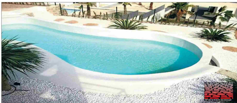
Las piscinas de tonalidad blanca dan la sensación de aguas cristalinas.

"La contra es que se producen desprendimiento de calugas a lo largo de su vida útil. Reponer una caluga es muy barato. Lo puede hacer el mismo cliente con pegamentos que están en el mercado. Pero para poder reponer la caluga hay que vaciar la piscina, por lo que se pierde el agua. Y es lo que estamos tratando de no hacer en estos tiempos", observa.