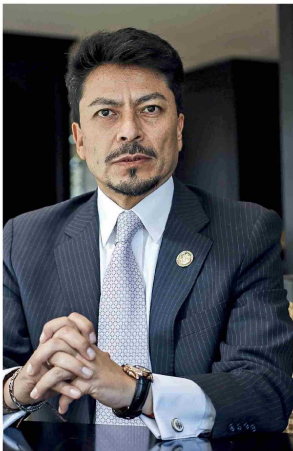
► El canciller de Bolivia, Fernando Aramayo, en entrevista con La Tercera.