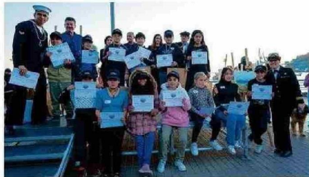
PARTICIPANTES DE LA CATEGORÍA PREADOLESCENTE.