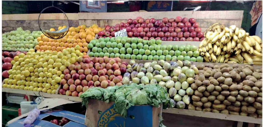
PRODUCTOS LOCALES MUESTRAN mayor estabilidad frente al alza de costos en la Vega de Los Ángeles.

Al respecto, Mellado indicó que "el perejil, el cilantro, las zanahorias y las manzanas sufrirían cambios mínimos". A diferencia de ello, advirtió que los cítricos, el tomate, el pepino y los