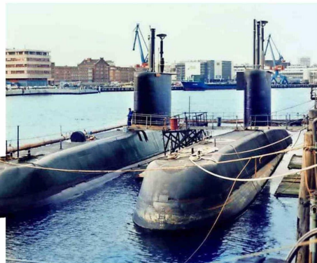
El "Thomson" y el "Simpson" pasaron por un periodo de reparación para extender su vida útil.

Los roles de los submarinos convencionales han evolucionado significativamente. Gracias a la tecnología moderna, han pasado del ataque clásico a unidades de