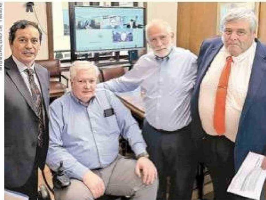
El alcalde de Timaukel, Luis Barria (extremo derecho), junto a su administrador José Barria y al senador Alejandro Kusanovic, captados en su reciente visita al ministro de Vivienda y Urbanismo, Carlos Montes (al centro).

Con ello se logrará cimentar la consolidación del nuevo pueblo como la futura capital comunal del austral territorio, tal como lo viene proyectando la administración comunal de Barria y de sus antecesores, por lo que resulta fundamental destinar el conjunto de una treintena de viviendas para los pobladores que lleguen a radicarse en el sur de Tierra del Fuego. Por otro lado, el pueblo en ejecución será el punto de partida del crecimiento turístico de la comuna, que podrá duplicar su actual número de visitantes en pocos años.