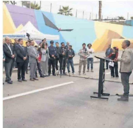
BARRA PONE EN VALOR EL ARTE PÚBLICO, LA IDENTIDAD REGIONAL.

La iniciativa fue impulsada por Escondida BHP, la Delegación Presidencial Regional, Ministerio de Obras Públicas, Ministerio de Cultura, Artes y Patrimonio, Municipalidad de Antofagasta y Asociación de Industriales de Antofagasta (AIA), en el marco de un proyecto colaborativo orientado al mejoramiento del entorno urbano y la puesta en valor del espacio