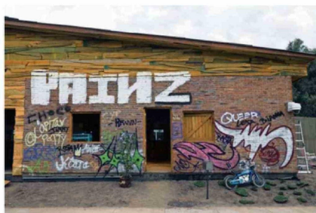
QUIENES QUEDEN ÚLTIMOS VIVIRÁN EN LA "CASA ABANDONADA".