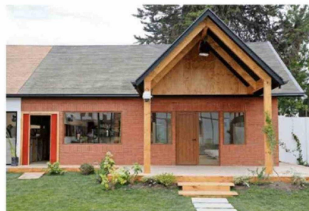
ASÍ LUCE LA "CASA TEMÁTICA".

de cálculo, ingenieros civiles, topógrafos y un montón de profesionales trabajando para darle a todas las terminaciones un carácter realista", explicó.