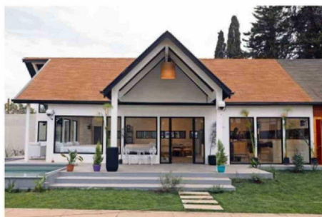
LA "CASA LUJOSA" SERÁ PARA LOS GANADORES DE LA SEMANA