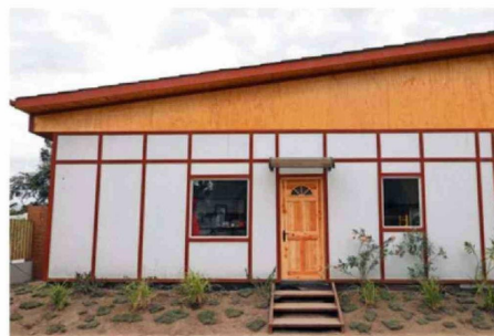
LOS TRABAJOS INICIAN CON QUIENES VIVAN EN LA "CASA SEMANERA".