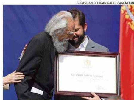
En 2023 recibió el Premio Nacional de Humanidades.

PENSAMIENTO Y LEGADO Hasta sus últimos días fue profesor emérito de la Uni-