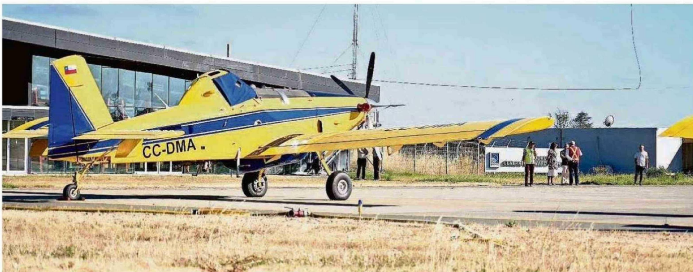
LAS AUTORIDADES DESTACARON LA IMPORTANCIA DE CONTAR CON ESTE TIPO DE RECURSOS EN LA REGIÓN.