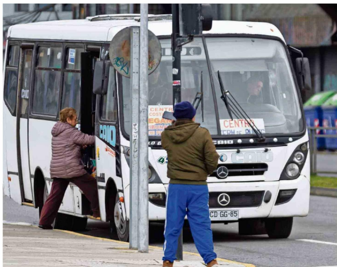
SE ESTÁ TRABAJANDO EN UN SISTEMA REGULADO PARA CONTAR CON SERVICIOS DONDE HOY NO HAY.