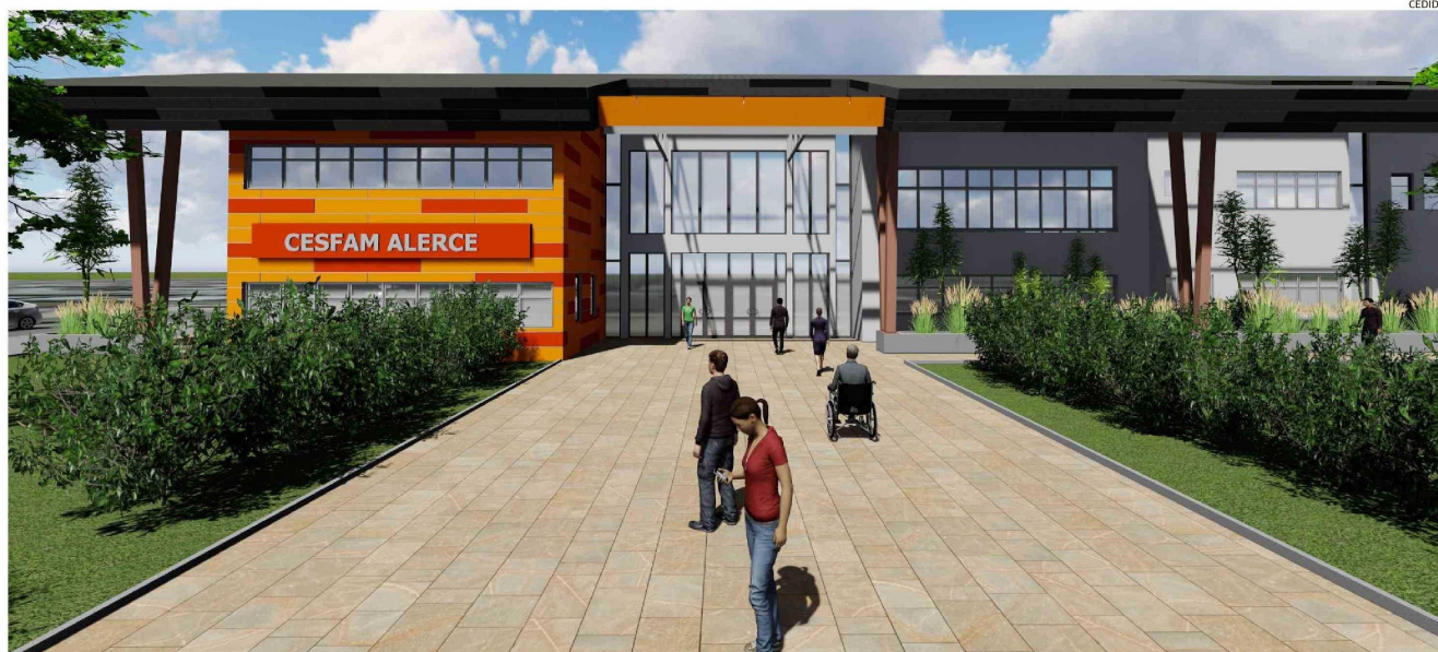
EL NUEVO CESFAM DE ALERCE CONTEMPLA 3.065,83 METROS CUADRADOS, UN PROYECTO DE COSAM Y UNA BASE SAMU.