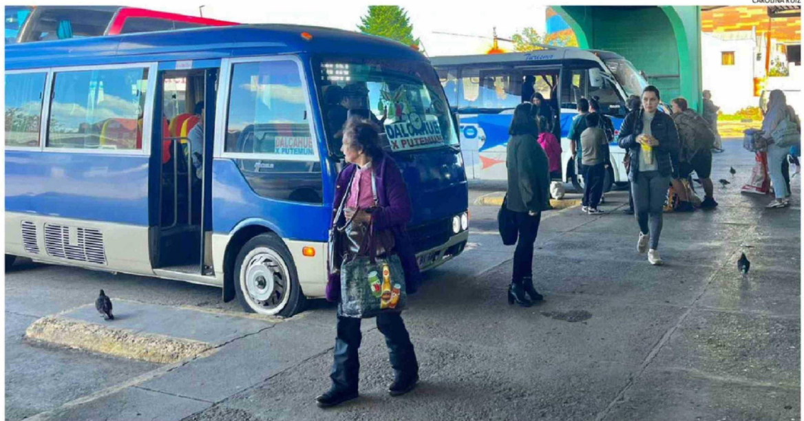
EN EL TERMINAL DE BUSES MUNICIPAL DE CASTRO LOS USUARIOS LAMENTARON EL ALZA QUE COMIENZA DESDE HOY Y QUE SE EXTENDERÍA EN LA SEMANA CON OTRAS EMPRESAS.

Por su parte, Buses Javiera informó un incremento en sus recorridos