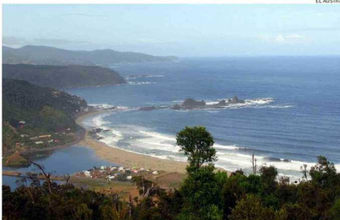
SAN JUAN DE LA COSTA ESTÁ AFECTADO POR EL CLIMA Y EL MAL CAMINO.

“Aunque el movimiento turístico en esta época no es alto, estas actividades permiten generar dinamismo en los meses más lentos. Hoy estamos atentos a lo que ocurra y a las posi-