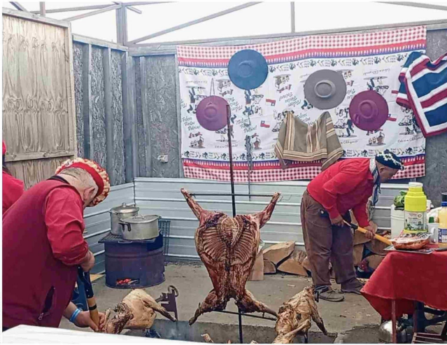
El asado que une a la Patagonia.

● La vigésima tercera edición del Asado Internacional reunió a cientos en Porvenir para celebrar la tradición más sabrosa del verano fueguino.