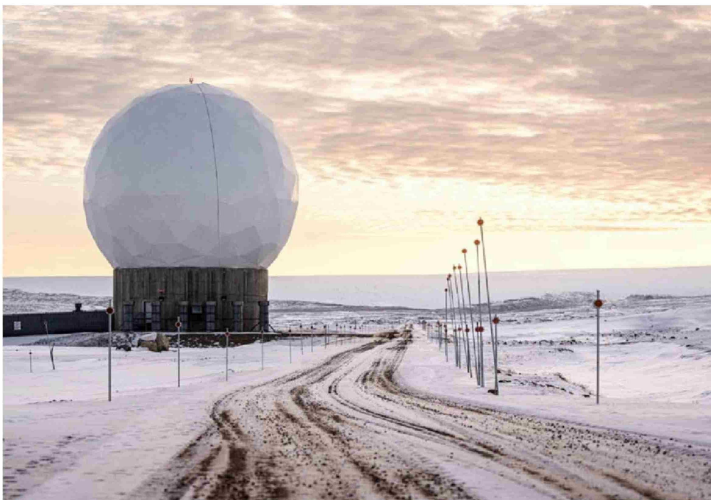
► Vista de la Base Espacial Pituffik en Groenlandia, la única instalación militar estadounidense en el Ártico.

Tiraje: 78.224 Lectoría: 253.149 Favorabilidad: No Definida