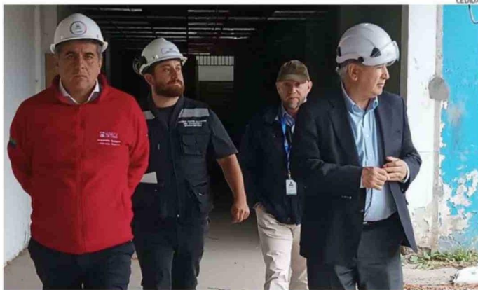
EL GOBERNADOR ALEJANDRO SANTANA (DE ROJO) JUNTO AL ALCALDE BERTÍN (CON CAMISA CELESTE) EN EL LICEO.

Además, a inicios de marzo, la misma empresa ingresó una denuncia formal ante el