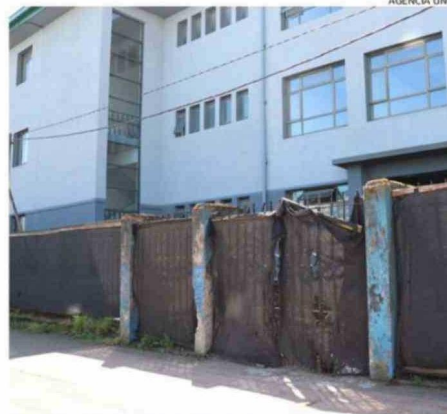
EL LICEO ESTÁ ABANDONADO, SEMI DESTRUIDO Y DESMANTELADO.

era el costo de inversión para la reposición del recinto, proveenientes del Fndr. Inicialmente se aprobaron $7.239 millones y luego, en el 2022, se sumaron $1.402 millones.