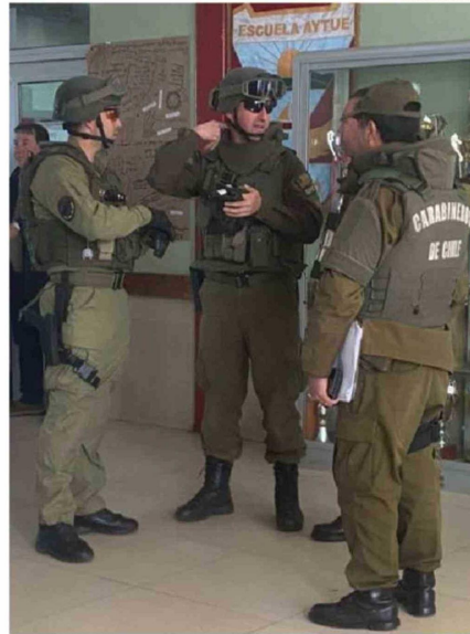
EFFECTIVOS DEL GOPE REALIZARON DILIGENCIAS EN EL LICEO.

Por su parte, en la capital chilota durante la jornada de este viernes se prendió nuevamente la alerta por un mensaje de atentado. En esta ocasión, no se anunció un baneo escolar, sino que la