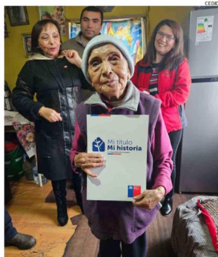
LA ADULTA MAYOR DE 93 AÑOS MUESTRA SU TÍTULO DE DOMINIO.