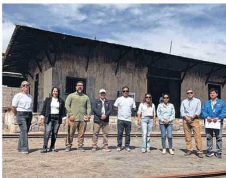
EL ENCUENTRO TIENE AMPLIA CONVOCATORIA.

dos, públicos, emprendedores, estudiantes y conversamos acerca de lo que queremos construir. En este caso desde Arica hacia el futuro, basados principalmente en la riqueza geográfica que tenemos, un lugar muy rico en capacidades de prototipado, por ejemplo para la agricultura”, explicó el director del